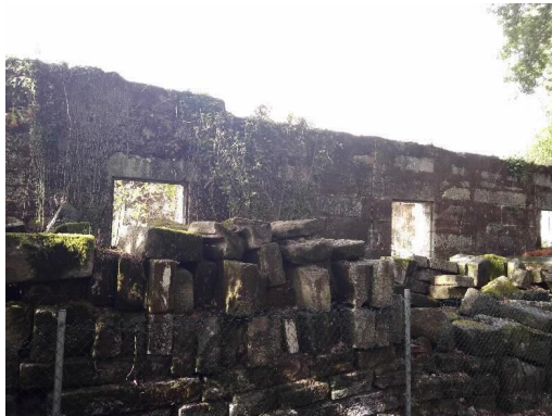
Chalé de Don Luís lateral Sur e pedras da planta derrubada.

PARLAMENTO DE GALICIA REGISTRO XERAL ENTRADA Data asento: 11/09/2019 18:24:47 Nº Registro: 55530 Data envío: 11/09/2019 18:24:47.411