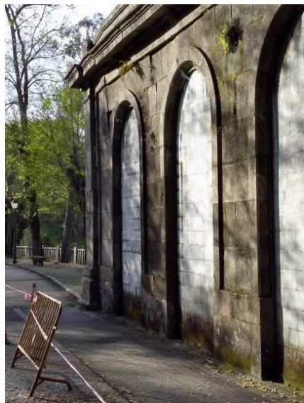
Pared lateral pos derrubamento 2019. (Baranda)