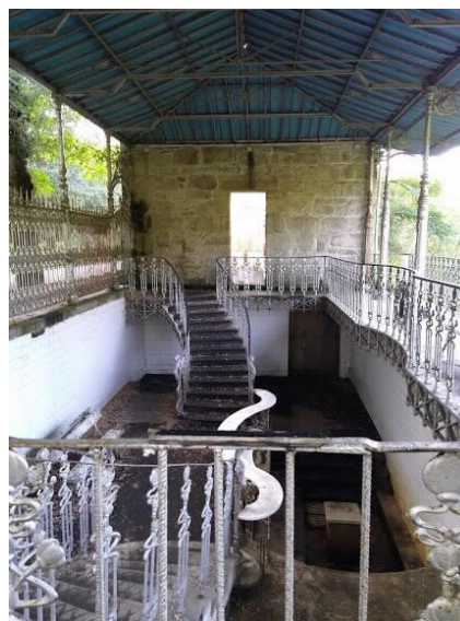
Interior Fonte de Troncoso

CSV REXISTRO uwHrBLKs Verificado https://seecta.parlamentodegalicia.gal/tramites/csv/