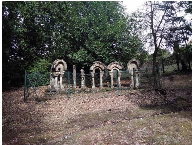
Xanelas Románicas completo