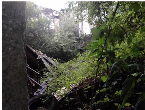
Chalé de Don Jaime interior

PARLAMENTO DE GALICIA REGISTRO XERAL ENTRADA Data asento: 11/09/2019 18:24:47 Nº Registro: 55530 Data envío: 11/09/2019 18:24:47.411