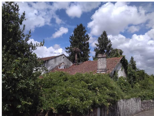
Chalet Villa Flora lateral Este e cuberta.