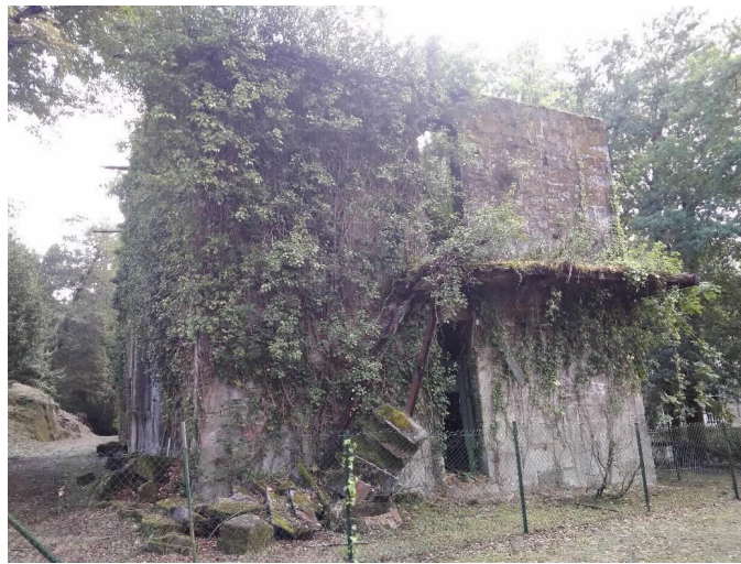
Chalé de Dona María Lateral Norte e traseira

PARLAMENTO DE GALICIA REGISTRO XERAL ENTRADA Data asento: 11/09/2019 18:24:47 Nº Registro: 55530 Data envío: 11/09/2019 18:24:47.411