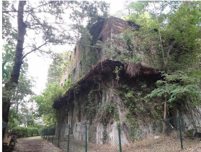
Chalé de Dona María fachada e lateral Sur

CSX4 REXYSTR0CuwHrBLK5 Verificado https://seecta.parlamentodegalicia.gal/tramites/csv/