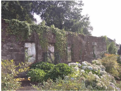
Chalé de Don Luís lateral Norte