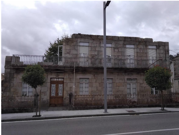
Hotel Roma Fachada

CSX4 REYXSTR0CuwHrBLK5 Verificación https://seecta.parlamentodegalicia.gal/tramites/csv/