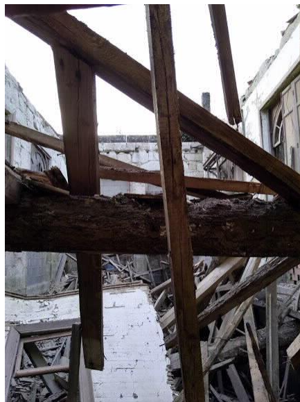
Interior Fonte de Troncoso.

Rúa do Hórreo, s/n. Tel. 0034 981 551 545 Fax. 0034 981 551 420. Fax prensa: 0034 981 551 421 gp-bng@parlamentodegalicia.gal 15702 Santiago de Compostela Galiza