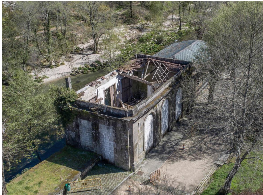
Fonte de Troncos vista aérea.

PARLAMENTO DE GALICIA REGISTRO XERAL ENTRADA Data asento: 11/09/2019 18:24:47 Nº Registro: 55530 Data envío: 11/09/2019 18:24:47.411