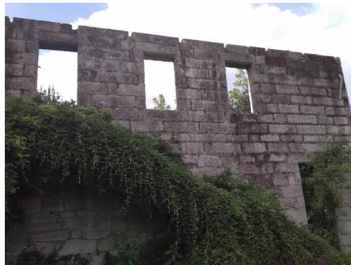
Chalé de Don Jaime lateral Sur

CSX4 REXYSTR0CuwHrBLK5 Verificado https://seecta.parlamentodegalicia.gal/tramites/csv/