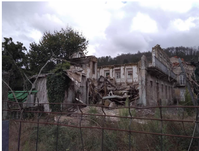
Hotel Roma Lateral Este

PARLAMENTO DE GALICIA REXISTRO XERAL ENTRADA Data asento: 11/09/2019 18:24:47 Nº Rexistro: 55530 Data envío: 11/09/2019 18:24:47.411