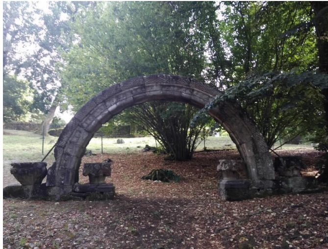
Arco Románico completo