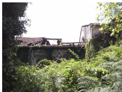
Chalet Villa Flora frontal e cuberta

CSX4 REXYSTR0CuwHrBLK5 Verificado https://seceda.parlamentodegalicia.gal/tramites/csv/