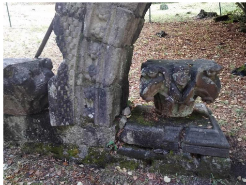
Arco Románico detalles