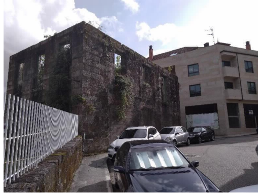
Chalé de Don Jaime lateral Norte