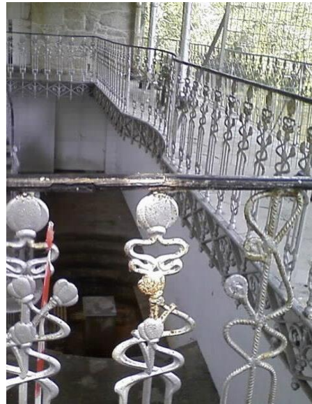
Interior Fonte Troncoso (forxa)

CSV REGISTRO uwHrBLKS Verificado https://seecta.parlamentodegalicia.gal/tramites/csv/