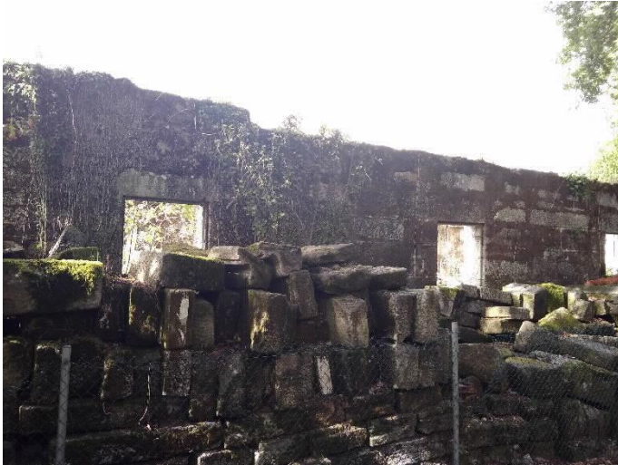
Chalé de Don Luís lateral Sur e pedras da planta derrubada.

Rúa do Hórreo, s/n. Tel. 0034 981 551 545 Fax. 0034 981 551 420. Fax prensa: 0034 981 551 421 gp-bng@parlamentodegalicia.gal 15702 Santiago de Compostela Galiza