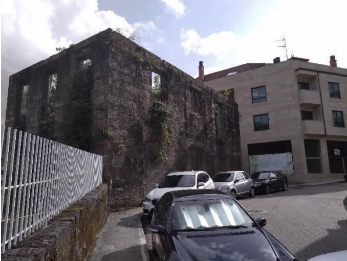
Chalé de Don Jaime lateral Norte