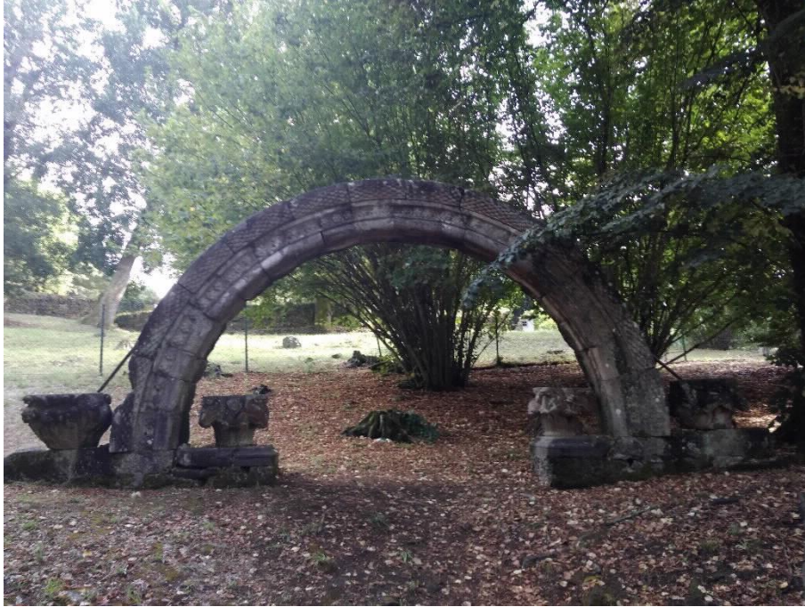
Arco Románico completo