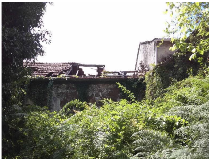
Chalet Villa Flora frontal e cuberta