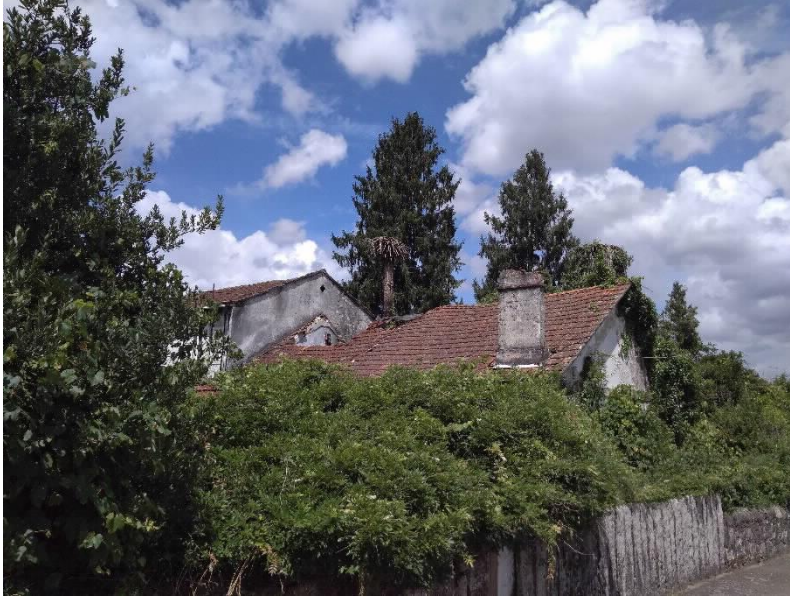
Chalet Villa Flora lateral Este e cuberta.