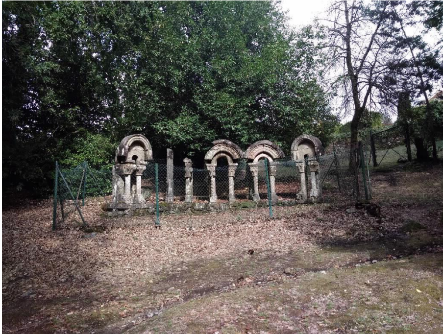
Xanelas Románicas completo